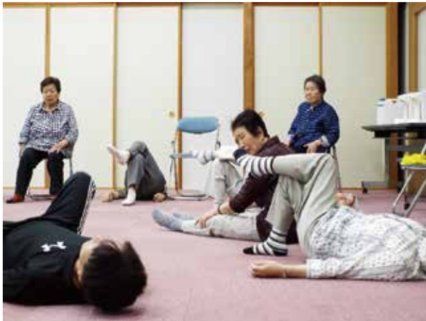
(第二の心臓ふくらはぎを刺激)

護予防に取り組んでいたというので、本当にありがたいです。 今回教えて頂いたのは、肩こりなどの緩和に肩甲骨の脱力方法、体幹（背中や腰）仙骨を自身の体重で整えて脱力、腿の裏側のハムストリングを刺激して大腿四とう筋を緩める感じでしょうか（腿の前側の筋肉がストッパーの役目になって固くなって足の出が悪くなる）意外と力を抜くことの難しい事が判りました。