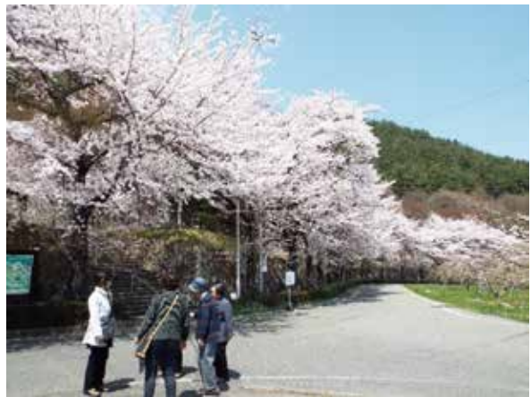
(デイラぼっち公園)