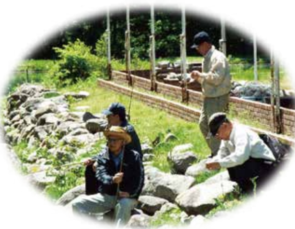
(またエサをとられました)