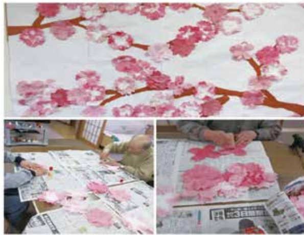
（壁に貼られた大作）

施設名の様に「はるかぜ」に乗りさくらそよそよ大きな壁に、綺麗な大輪の花を咲かせています。障子紙を使って形をとって、色をつけて古木のイメージで作りました。利用者の手から産みだされる幾重にも見えるシルエットは圧巻です。是非一度、見学して見ては如何でしょうか。