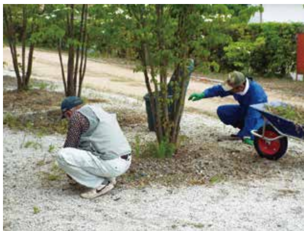
(街路の草とり作業)

社協の障がい者支援の取り組みの一環として就労センターを利用して障がい者の工賃アップを図る事を目的に5月より週1回、社協施設の清掃等をお願いすることにしました。