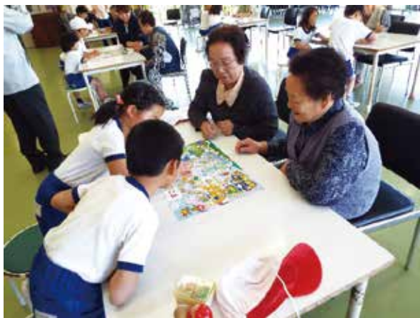
(すぐろくで遊びました)

今後7月、9月に2回、12月に2回と計画されていますので、その都度記事を掲載していきます。ホームページも見てください。