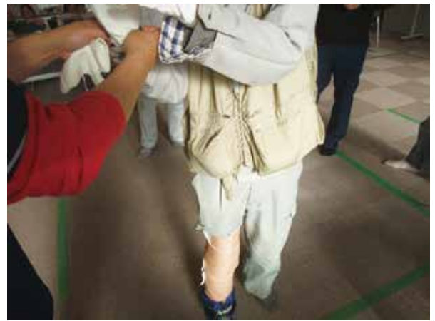
(器具をつけてひざを固定)