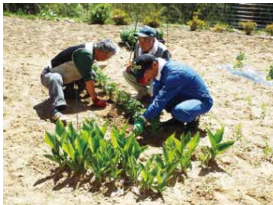
（畑の作業をする皆さん）

南側の中庭では、就労センターの皆さんが、花苗の定植に汗をかきました。労働契約の一環として、今回ははるかぜの環境づくりに労力をいただきました。野菜の苗もすでに植えられていて、大きくなってきています。今後の成長が楽しみです。