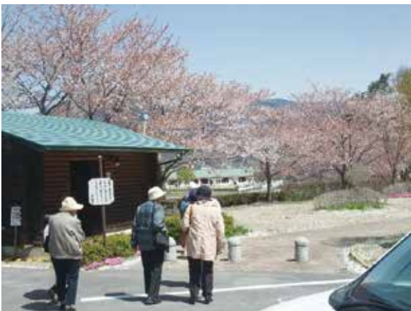
(公園を散策する利用者)

バラが有名だそうです。時期が合わずに観る事は出来ませんでした。公園には珍しい緑色の桜が数本あり、皆さん興味深めでした。