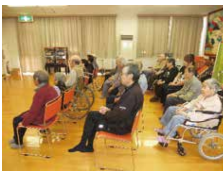
（交流室で観賞する利用者）

また、デイの交流室では第2第4の火曜日の午後を基本にハーモニカサークルの皆さんが練習しており、こちらも仲間を募っています。尚、交流室は冷房完備でカラオケ設備等もありますので仲間等の憩いの場としても活用して下さい。