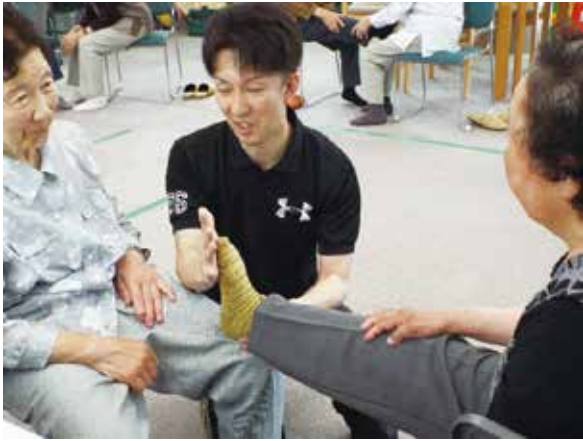
（足裏の調整をする先生）

今回は歩き方に重点を置いて正しい歩き方（かかとから接地して土踏まずを通り、親指の方向に抜ける）をすると、転倒の予防はもちろん、体のバランスも正常になって、良い姿勢も保たれると一石二鳥、三鳥の優れた技です。