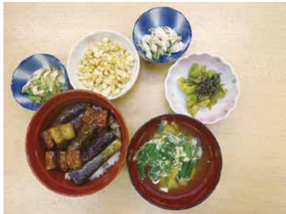
(夏野菜のメニュー)

ヘルパーステーションで、夏野菜を使い少し工夫を凝らした、訪問時の利用者メニューを考えた調理実習を行いました。