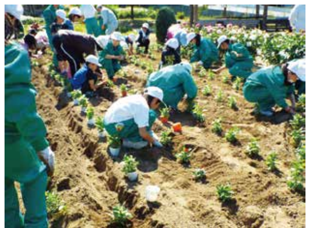
(花苗を植える団員)