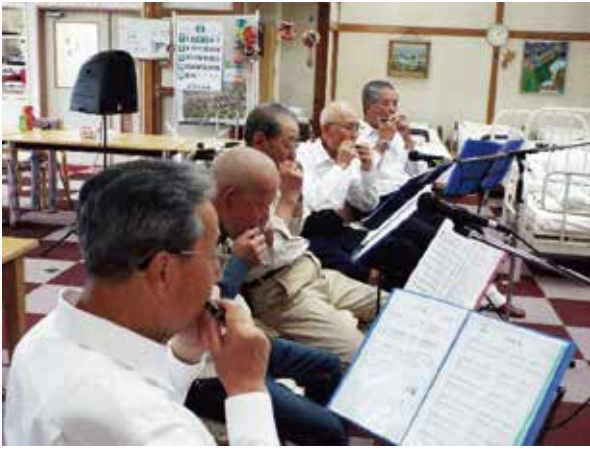
(演奏するメンバー)

「おぼろ月夜」「夏は来ぬ」「夏の思いで」「とんがり帽子」など皆さん知っている曲を選んで合奏したり、個々に得意な曲を独奏していただきました。